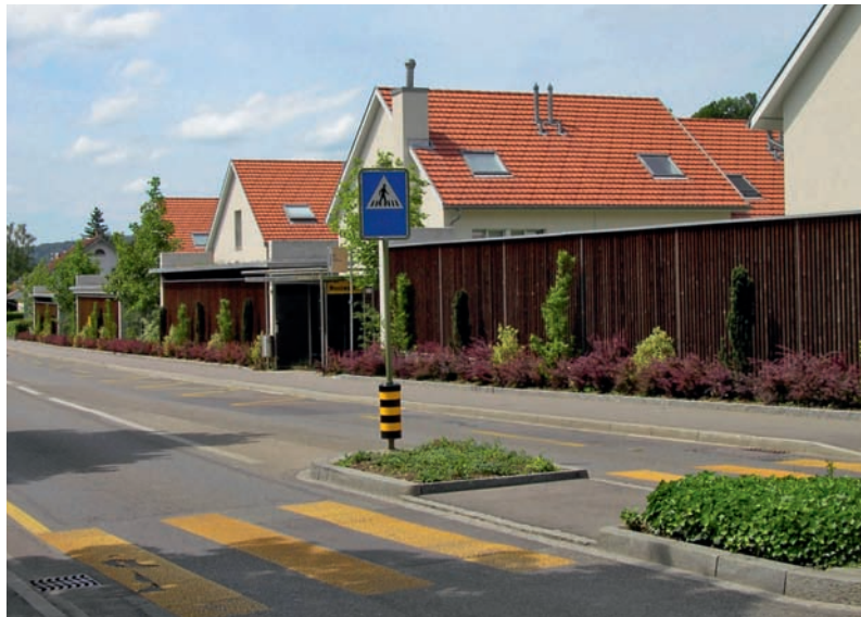
Attraktive Lärmschutzwand als integrierter Bestandteil einer Überbauung.

Für Holz im Aussenbereich sind rauhe, gehobelte, gerillte oder sonstwie bearbeitete Oberflächen erhältlich. Die druckimprägnierten Holzprodukte zeichnen sich durch ein gleichmässiges Erscheinungsbild